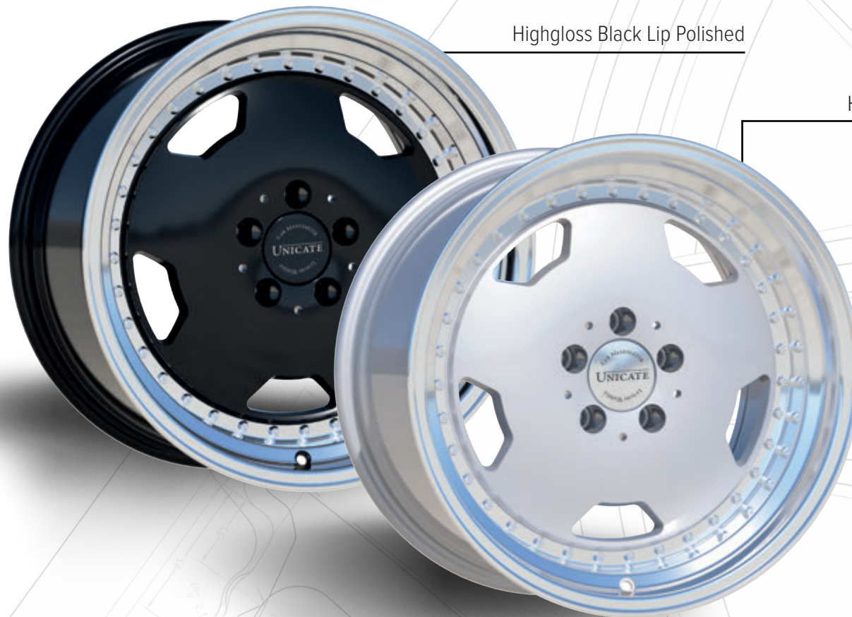
Highgloss Black Lip Polished

Wunderschön in das Design historischer Mercedes-Benz-Modelle fügt sich die UNICATE Aero Classic ein. Während der massiv anmutende Felgenstern wahlweise in Hyper Silver oder in Highgloss Black erhältlich ist, lassen die polierten Stufenbetten samt Zierverschraubung einen mehrteiligen Aufbau vermuten.