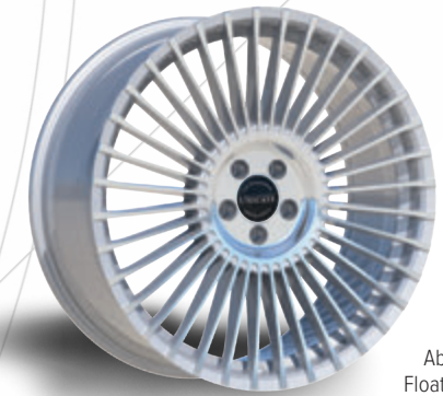
Abb. ohne Floating Cap