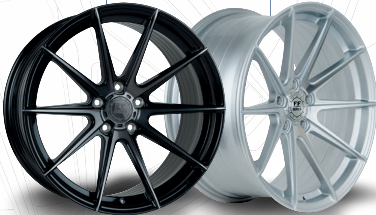
Hyper Silber Polished Surface

Coming soon: FF440 FL Verfügbar ab Frühjahr 2024!