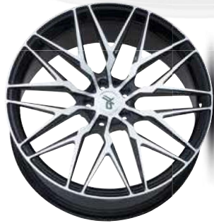
black full polish

Extrem filigran, sensationell leicht – und trotzdem hochfest: Mit ihrer Produktion in Schmiedetechnologie verschiebt unsere OXFORGED-Familie schier die Grenzen der Physik. Auch optisch dokumentiert das Y-Speichen-Modell OXFORGED 5 dies im futuristisch anmutenden Finish silver brush / hand polish mit in Handarbeit gebürsteten Fronten vor ebenso auf Hochglanz polierten Oberflächen. Auf Wunsch sind unzählige Custom-Oberflächenveredelungen erhältlich.