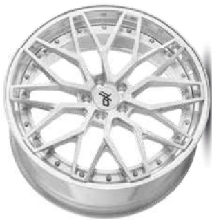
silver brush / lip polish