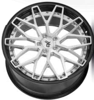
silver brush / lip black

Klassisch und doch außergewöhnlich – obwohl die MP6 aus unserer geschmiedeten OXFORGED MULTIPIECE-Serie ein klassisches Y-Speichen-Design zeigt, erscheint das Rad doch überaus raffiniert. Der filigrane Stern des Mehrteilers läuft bis in den Rand des gestuften Felgenbetts, sodass die in 20- und 21-Zoll-Dimensionen erhältliche MP6 besonders groß und elegant wirkt.