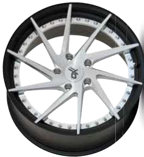
silver brush / lip black