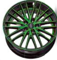
neon green polish