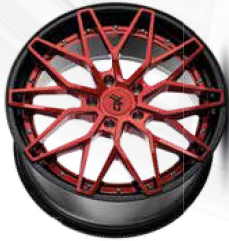
candy red brush / lip black