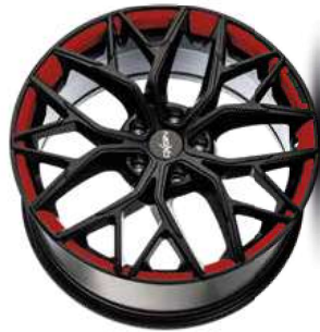
Folie Felgenbett weiß, Speiche rot