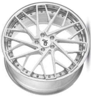
silver brush / lip polish