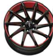
Folie Felgenbett red, Speiche red