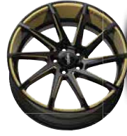
Folie Felgenbett gold, Speiche gold