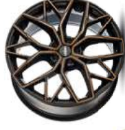
copper polish matt