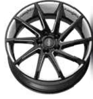
Folie Felgenbett white, Speiche white