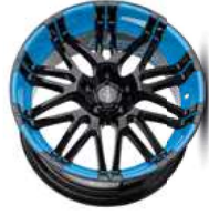
Folie light blue