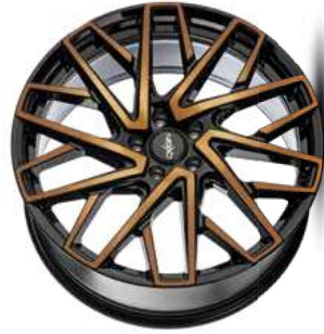
copper polish matt