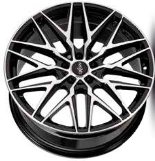
black full polish