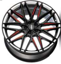
Folie Felgenbett weiß, Speiche rot