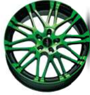
neon green polish