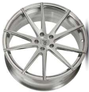
silver brush / hand polish