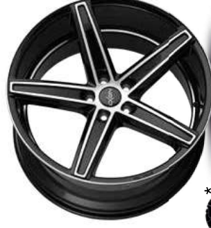
black full polish