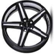
Folie Felgenbett white, Speiche white