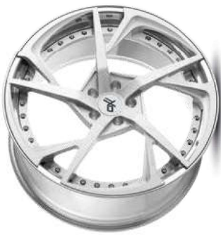
silver brush / lip polish