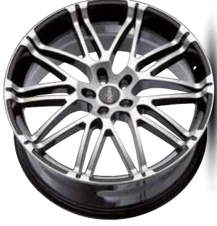
black full polish