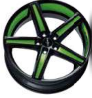
Folie Felgenbett green, Speiche green