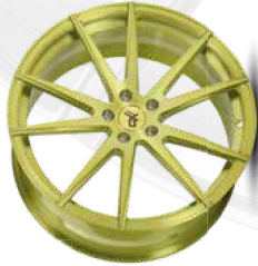
lemon green brush