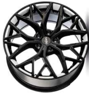
Folie Felgenbett weiß