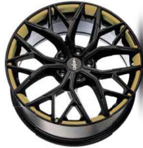
Folie Felgenbett gold