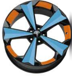
Folie Felgenbett orange, Speiche light blue