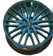
light blue polish