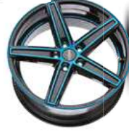
light blue polish