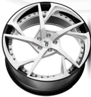
silver brush / lip black

Mit den fünf rotierenden, optisch ineinander verzweigten und bis ins Stufenbett auslaufenden Speichen ihres geschmiedeten Felgensterns ist die MP3 das rasanteste Design unserer OXFORGED MULTIPIECE-Linie. Wie bei allen unseren Mehrteilern üblich, lassen sich der gebürstete Stern und/oder das Felgenbett in einer der unzähligen hierfür wählbaren Farben finishen.