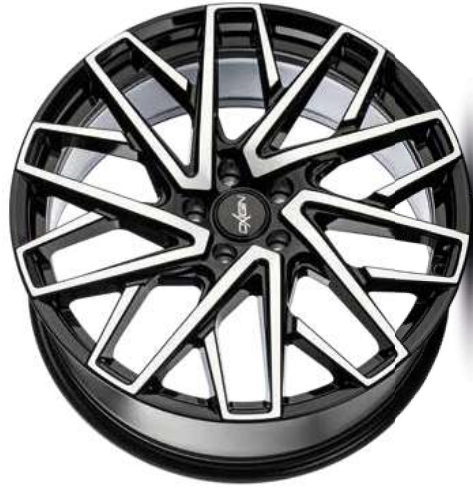
black full polish