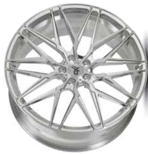
silver brush / hand polish