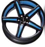
Folie Felgenbett light blue, Speiche light blue