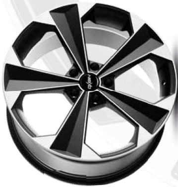
black matt polish