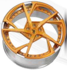
orange brush / lip polish