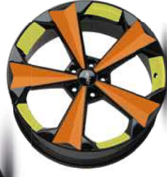
Folie Felgenbett yellow, Speiche orange