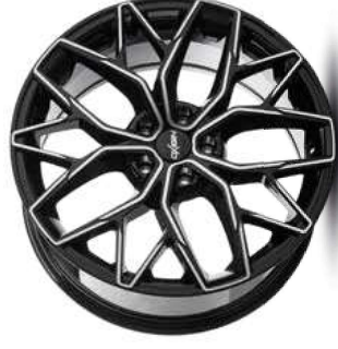
black full polish