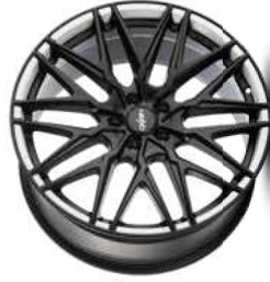
Folie Felgenbett white