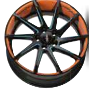
Folie Felgenbett orange, Speiche light blue