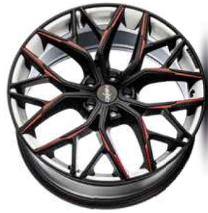
Folie Felgenbett weiß, Speiche rot