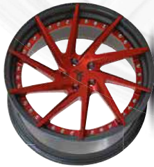
candy red brush / lip anthracite