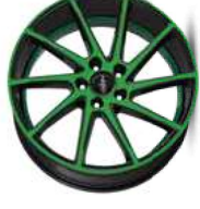
neon green polish