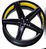
Folie Felgenbett yellow