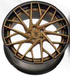
bronze brush / lip black