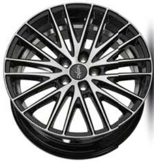
black full polish