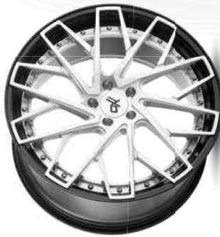
silver brush / lip black

Feingliedrig und dynamisch rollt die MP5 aus unserer OXFORGED MULTIPiece-Serie mit ihren rotatorischen, im gestuften Felgenbett verbundenen Y-Speichen ins Rampenlicht. Wie bei allen OXFORGED-Mehrteilern lassen sich Stern und Bett jeweils in einem breiten Farbspektrum lackieren, sodass die Kombinationsmöglichkeiten schier unendlich sind.