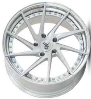
silver brush / lip polish