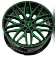
neon green polish