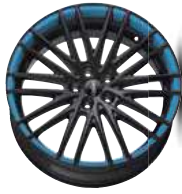
Folie light blue