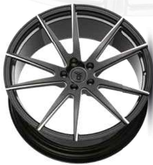
black full polish / undercut