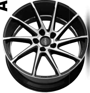
black full polish