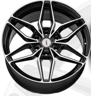
black full polish