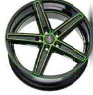
neon green polish